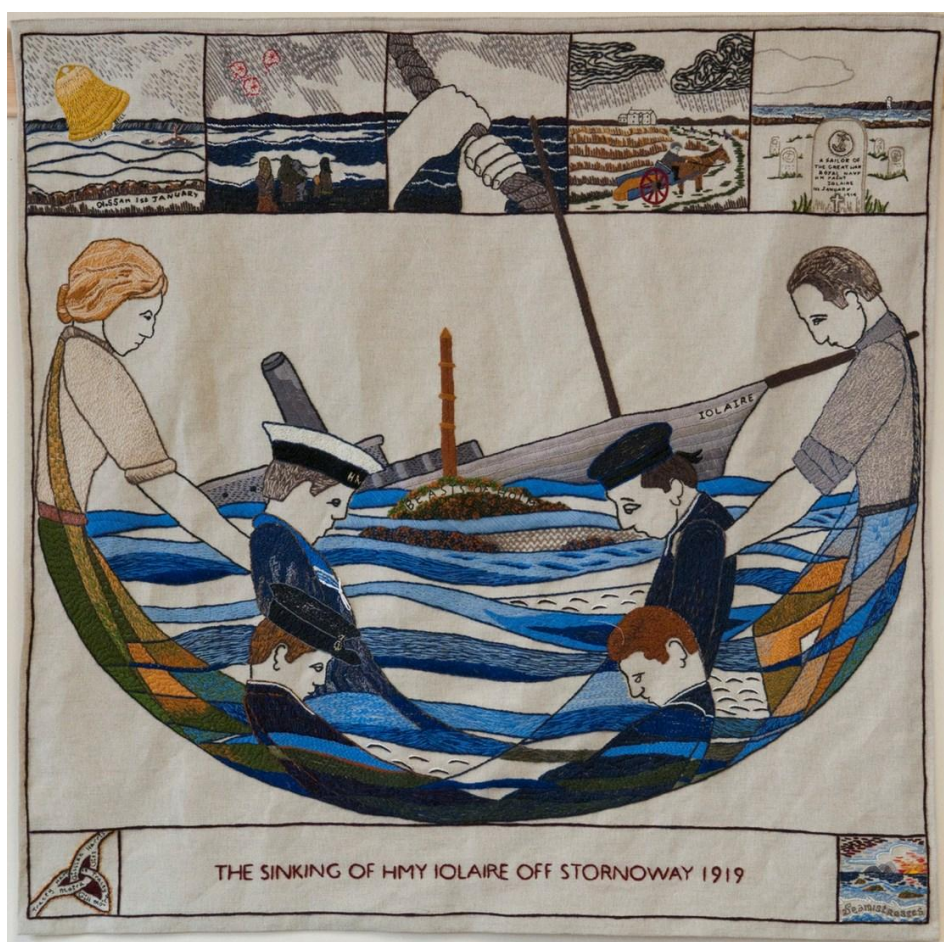
Le panneau Iolaire de la Grande Tapisserie d'Écosse

Les marins portaient leurs uniformes, y compris de lourdes bottes, ce qui rendait difficile la nage depuis l'épave; beaucoup d'hommes de cette époque n'avaient jamais eu l'occasion d'apprendre. De nombreuses chansons et poèmes, comme An Iolaire, décrivent les femmes de ces hommes trouvant leurs hommes échoués sur le rivage, le lendemain. Le naufrage est la pire catastrophe maritime dans les eaux du Royaume-Uni en temps de paix et la pire impliquant un navire britannique après celle le Titanic le 15 avril 1912.