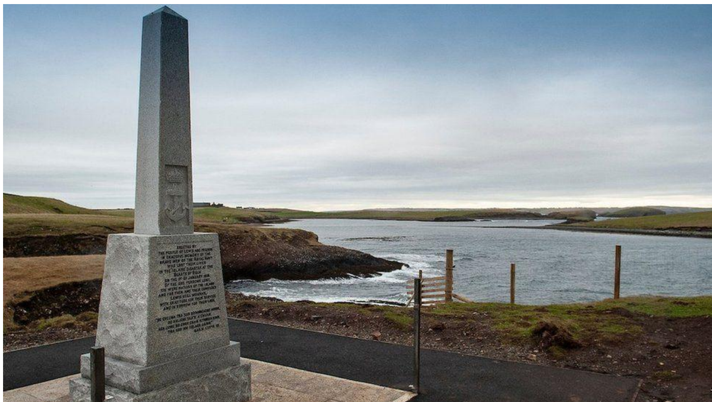
The Iolaire Memorial.