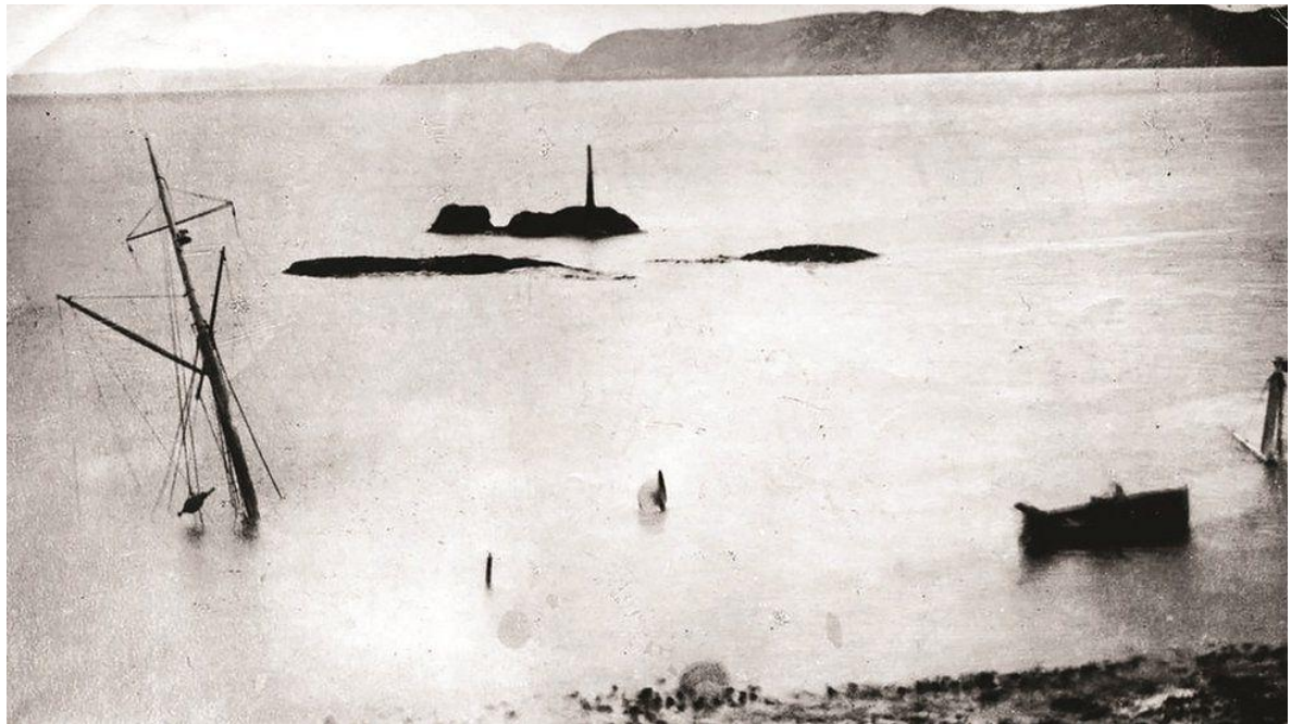
Le mât de l'Iolaire après son naufrage en janvier 1919